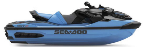
● НОВИЙ Gulfstream Blue Premium