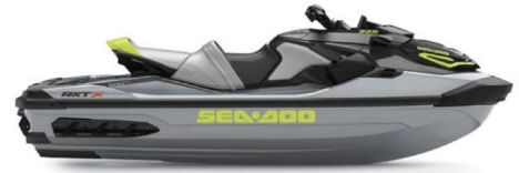
● Ice Metal and Manta Green