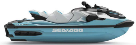
● Teal Metallic