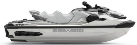
○ White Pearl Premium