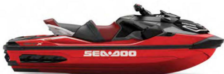
● НОВИЙ Fiery Red Premium