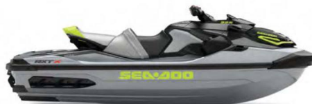
● НОВИЙ Ice Metal / Manta Green