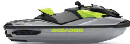
● НОВИЙ Ice Metal / Manta Green