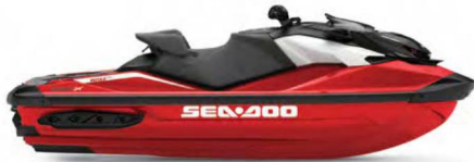
● НОВИЙ Fiery Red Premium