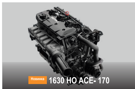
Новинка 1630 HO ACE-170

Новий двигун Rotax® 1630 HO ACE - 170 є найпотужнішим безнаддувним двигуном Rotax з усіх коли-небудь встановлюваних на гідроциклах Sea-Doo.