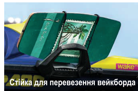
Стійка для перевезення вейкборда

Пілон для водних лиж висувної конструкції, що забезпечує легке й швидке встановлення й складання пілона, коли він не використовується. Крім того, він оснащений поручнем для спостерігача й відділенням для зберігання буксирного каната.