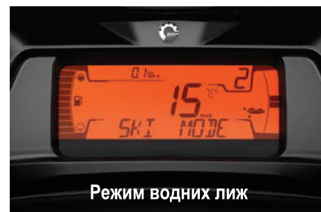
Режим водних лиж

Водонепроникний та ударостійкий кофр, розроблений спеціально для захисту телефону від ушкоджень.