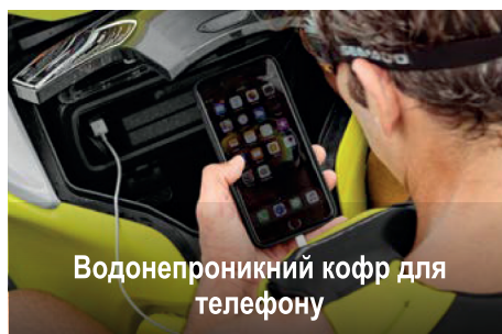
Водонепроникний кофр для телефону

Перша в галузі аудіосистема повністю водонепроникної конструкції заводської установки з підтримкою технології Bluetooth.