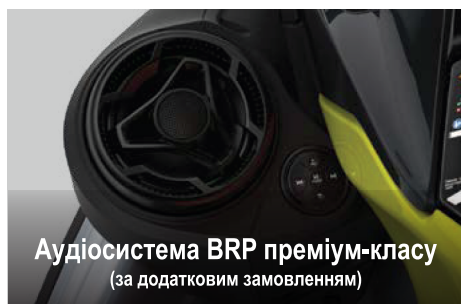
Аудіосистема BRP преміум-класу (за додатковим замовленням)

Перша в галузі аудіосистема повністю водонепроникної конструкції заводської установки з підтримкою технології Bluetooth.