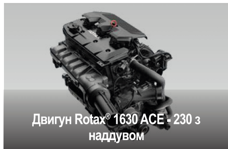
Двигун Rotax® 1630 ACE - 230 з наддувом

Цей потужний двигун оснащений нагнітачем наддуву і зовнішнім проміжним охолоджувачем в стандартній комплектації й оптимізований для роботи на звичайному стандартному пальному AI-98, що забезпечує суттєве зниження витрат на паливо.