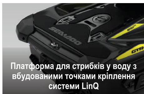
Платформа для стрибків у воду з вбудованими точками кріплення системи LinQ

Перша в галузі аудіосистема повністю водонепроникної конструкції заводської установки з підтримкою технології Bluetooth.