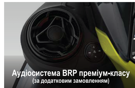
Аудіосистема BRP преміум-класу (за додатковим замовленням)

Передбачає запрограмовані позиції для швидкого регулювання кута диференту залежно від умов акваторії, які активуються за допомогою регуляторів на рукоятках керма.