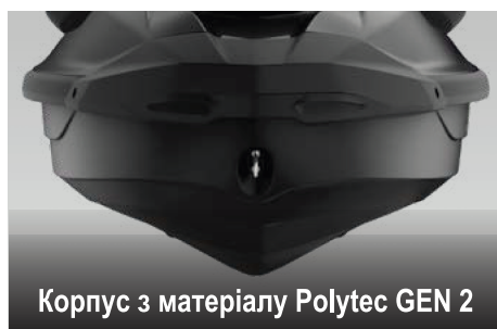
Корпус з матеріалу Polytec GEN 2

Елементи ексклюзивної системи швидкого кріплення допоміжного приладдя на великій платформі для стрибків у воду забезпечують легке встановлення аксесуарів для зберігання й перевезення різноманітних речей.