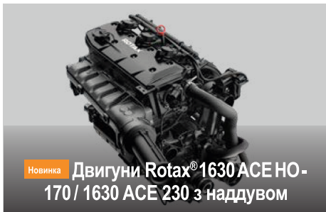
Новинка Двигуни Rotax® 1630 ACE HO - 170 / 1630 ACE 230 з наддувом

Перша в галузі аудіосистема повністю водонепроникної конструкції заводської установки з підтримкою технології Bluetooth