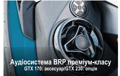
Аудіосистема BRP преміум-класу GTX 170: аксесуар/GTX 230: опція

Елементи ексклюзивної системи швидкого кріплення допоміжного приладдя на найбільшій в галузі платформі для стрибків у воду забезпечують легке встановлення аксесуарів для зберігання й перевезення різноманітних речей