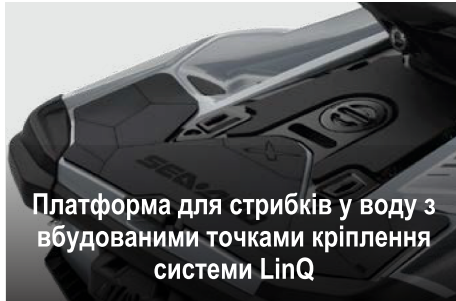
Платформа для стрибків у воду з вбудованими точками кріплення системи LinQ

Велике переднє багажне відділення з безпосереднім доступом, яке легко відкривається без необхідності підводитись зі свого місця.