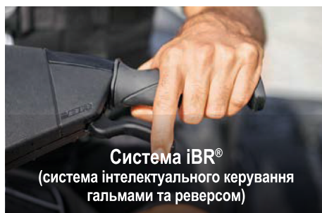
Система iBR® (система інтелектуального керування гальмами та реверсом)

Ця ексклюзивна технологія від Sea-Doo® оптимізує вихідну потужність двигуна, забезпечуючи покращення паливної економічності до 46%.