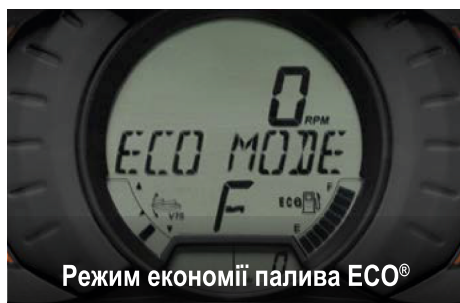
Режим економії палива ECO®

Надійний та маневрений для забезпечення передбачуваної керованості під час їзди в умовах спокійної води та помірного хвилювання.