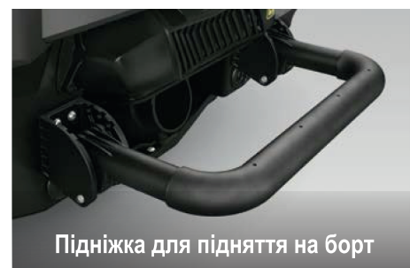
Підніжка для підняття на борт

Ексклюзивна система Sea-Doo®, iBR®, забезпечує скорочення гальмівного шляху гідроцикла й підвищення рівня керованості та маневреності під час руху на низьких швидкостях і заднім ходом.