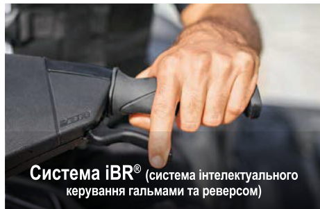
Система iBR® (система інтелектуального керування гальмами та реверсом)

Ексклюзивна система Sea-Doo®, iBR®, забезпечує скорочення гальмівного шляху гідроцикла й підвищення рівня керованості та маневреності під час руху на низьких швидкостях і заднім ходом.