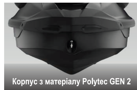
Корпус з матеріалу Polytec GEN 2

Ця ексклюзивна технологія від Sea-Doo® оптимізує вихідну потужність двигуна, забезпечуючи покращення паливної економності до 46%.