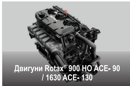
Двигуни Rotax® 900 HO ACE- 90 / 1630 ACE- 130

Ексклюзивна система Sea-Doo®, iBR®, забезпечує скорочення гальмівного шляху гідроцикла й підвищення рівня керованості та маневреності під час руху на низьких швидкостях і заднім ходом.