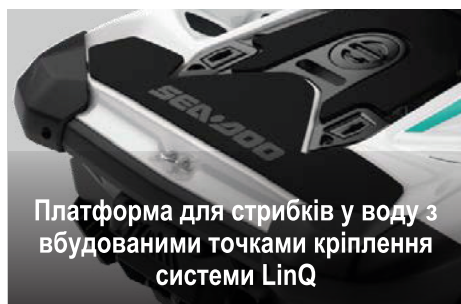
Платформа для стрибків у воду з вбудованими точками кріплення системи LinQ

Вражаючі 152 літрів герметичного багажного простору для безпечного зберігання й перевезення речей та приладдя.