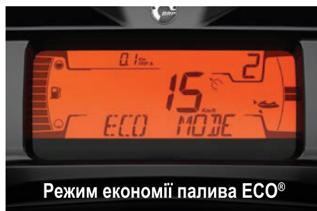
Режим економії палива ECO®

Елементи ексклюзивної системи швидкого кріплення допоміжного приладдя на великій платформі для стрибків у воду забезпечують легке встановлення аксесуарів для зберігання й перевезення різноманітних речей.