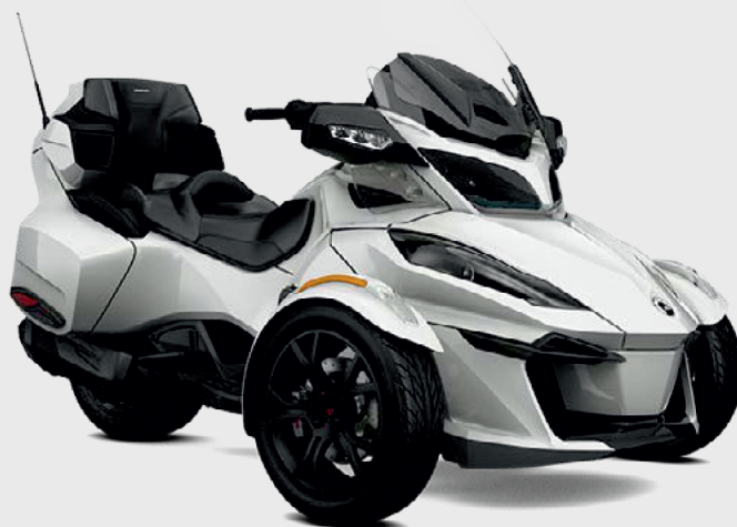
▭ "Перлисто-білий" (Pearl White)