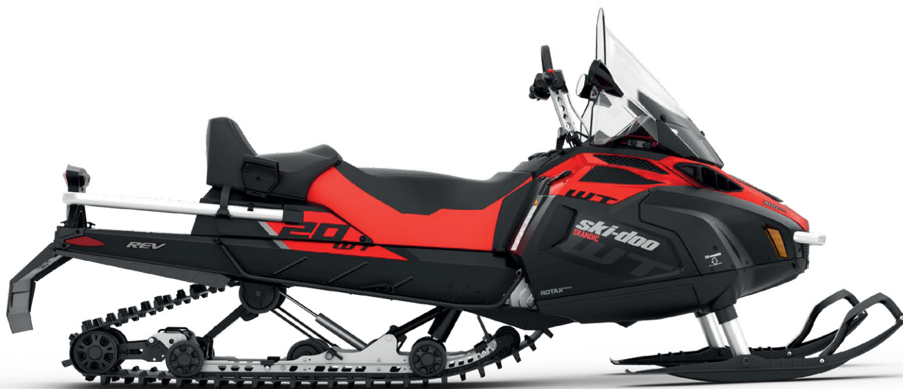
Зображено модель SKANDIC® WT 900 ACE