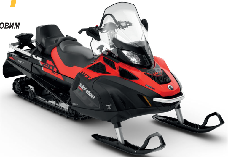
Зображено модель SKANDIC® WT 900 ACE