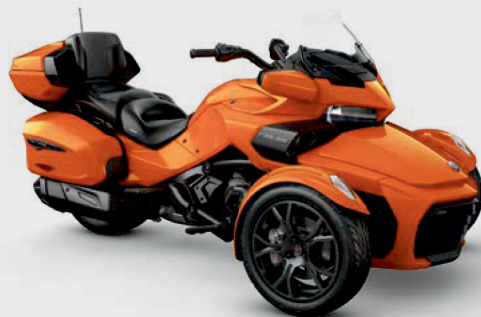
■ "Оранжевий металік фенікс" (Phoenix Orange Metallic)