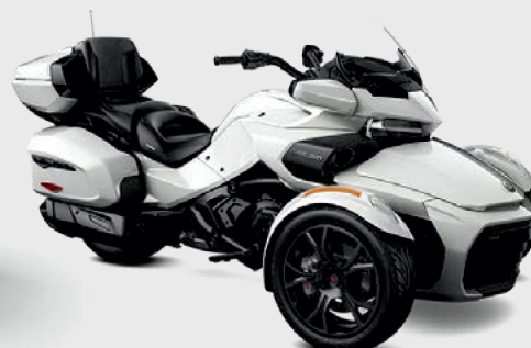
□ "Перлисто-білий" (Pearl White)