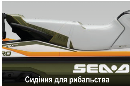
Сидіння для рибальства

Високотехнологічна система навігації, прокладання курсу та пошуку риби, яка застосовує технологію CHIRP (лінійна частотна модуляція) для отримання зображень з високою роздільною здатністю.