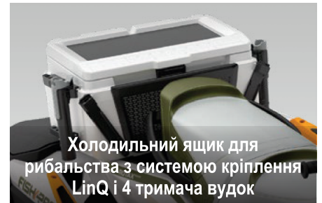
Холодильний ящик для рибальства з системою кріплення LinQ і 4 тримача вудок

Конструкція, оптимізована для забезпечення свободи рухів всією поверхнею гідроцикла, а також для підвищення рівня комфорту й стійкості в положенні, сидячи обличчям вбік.