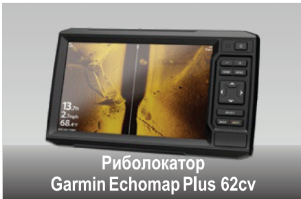
Риболокатор Garmin Echomap Plus 62sv

Високотехнологічна система навігації, прокладання курсу та пошуку риби, яка застосовує технологію CHIRP (лінійна частотна модуляція) для отримання зображень з високою роздільною здатністю.