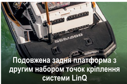
Подовжена задня платформа з другим набором точок кріплення системи LinQ

Місткий холодильний ящик для рибальства швидкозаставляваної/знімної конструкції, яка забезпечує легкий доступ і оснащена цілою низкою зручних характеристик.