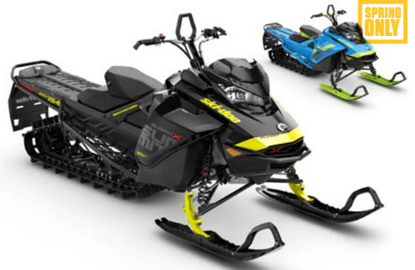
SUMMIT® X 154 850 E-TEC®